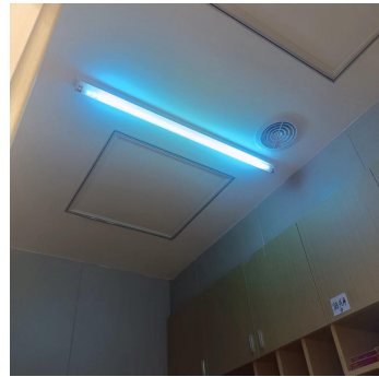
项目已安装紫外消毒灯管