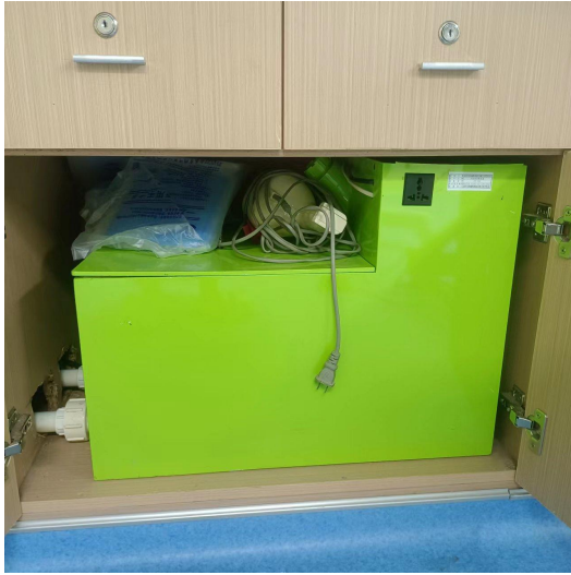
医疗废水处理设施