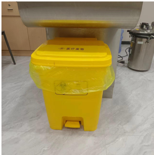
医疗废物暂存垃圾桶