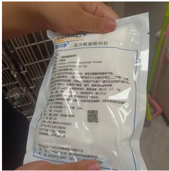
动物粪便及尿液消毒粉